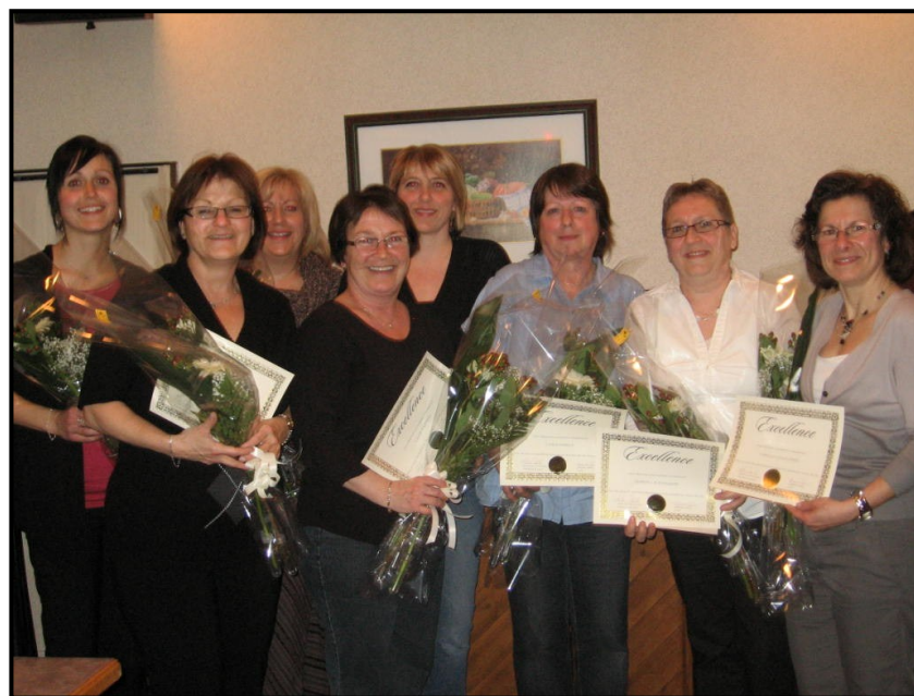
Infirmières honorées le 12 mai

* Information extraite des statuts et règlements du comité d'éthique